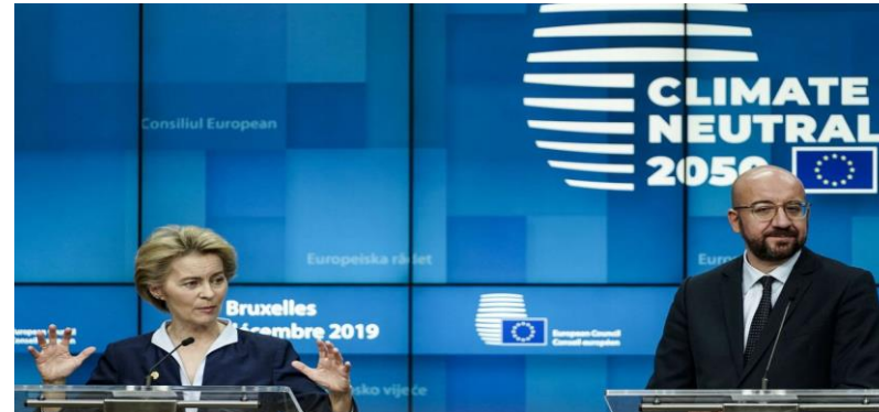
Short-term strategy Financing Sustainable Growth